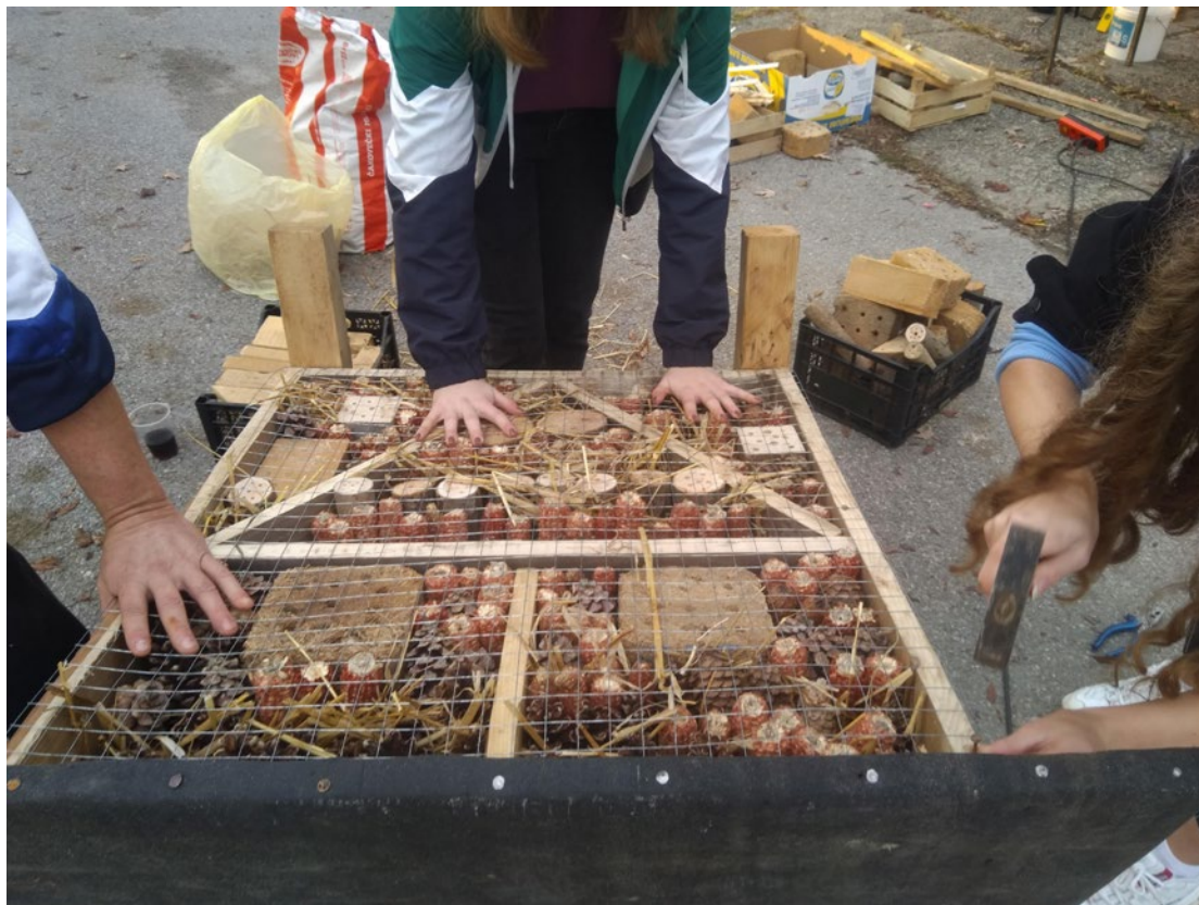
Autor fotografije: PETROŽE-KRUŠLJEVO SELO

Volonteri udruge izrađuju motele za kukce, koji će biti postavljeni kod Područne škole i u centru. Aktivnost izrade motela jedna je od aktivnosti ekološkog osvještavanja zajednice.