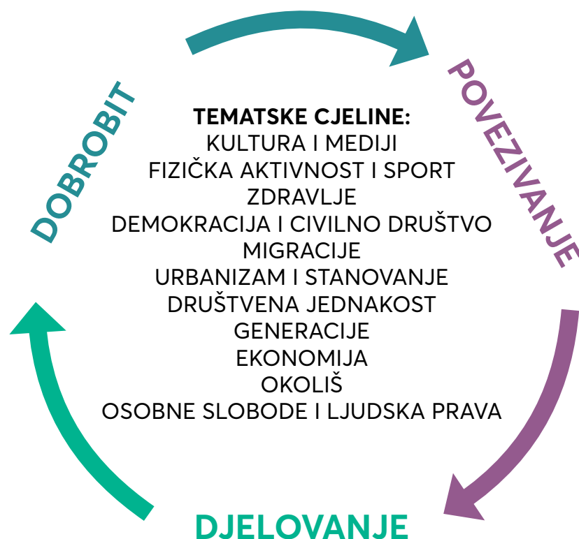
Slika 2. Povezanost domena i tematskih cjelina u predmetu Škola i zajednica

Odnos domena i tematskih cjelina u predmetu prikazan je na Slici 2.